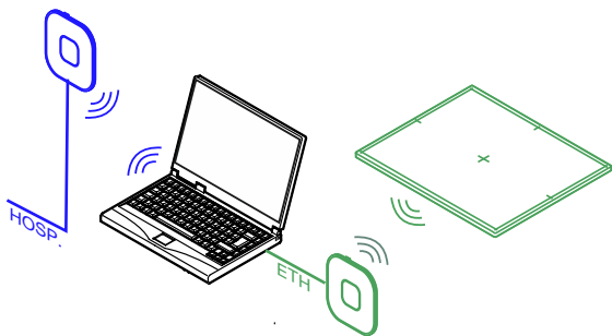
Obrázek 1: Přístupový bod připojený k pracovní pomoci síťového kabelu

Správa síťových připojení nevyžaduje žádnou interakci uživatele.