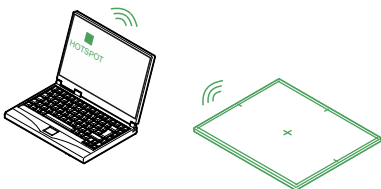
Figura 1: A estação de trabalho está em espera